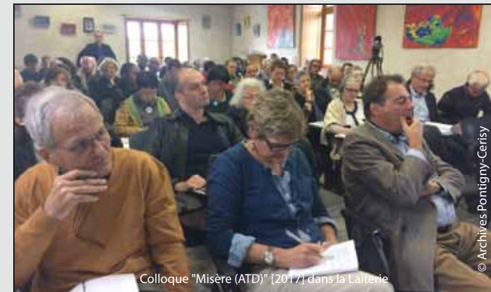
Colloque "Misère (ATD)" [2017] dans la Laiterie

- Offrir , outre l'intérêt du thème choisi, une grande qualité de l'accueil et une heureuse convivialité des rencontres .