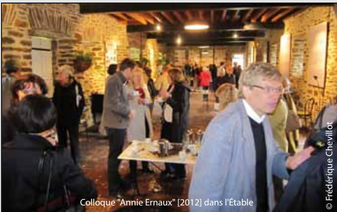
Colloque "Annie Ernaux" [2012] dans l'Étable