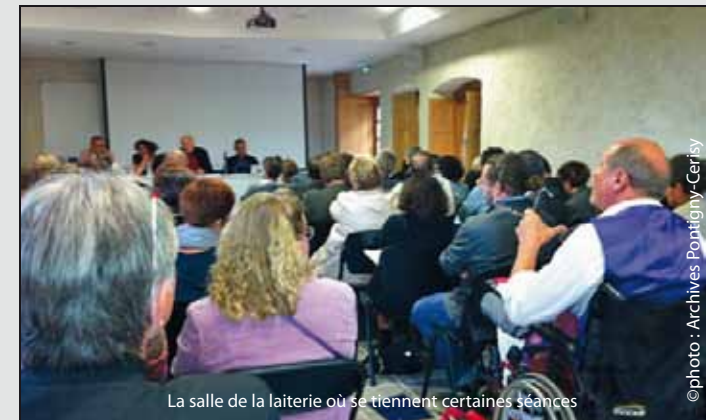
La salle de la laiterie où se tiennent certaines séances

- Offrir , outre l'intérêt du thème choisi, une grande qualité de l'accueil et une heureuse convivialité des rencontres .