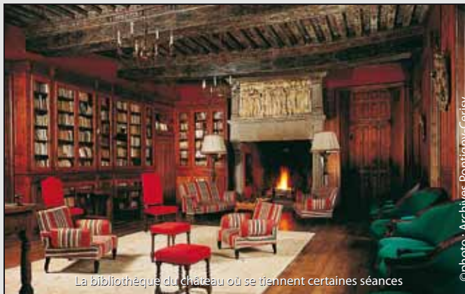
La bibliothèque du château où se tiennent certaines séances

Le site est classé Monument Historique "en raison de la qualité architecturale et de la grande cohérence de l'ensemble, en tant que haut lieu de la culture et de l'histoire, y compris celle de la pensée moderne".