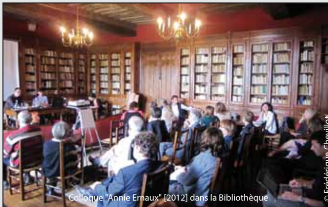
Colloque "Annie Ernaux" [2012] dans la Bibliothèque

☛ Le site est classé Monument Historique "en raison de la qualité architecturale et de la grande cohérence de l'ensemble, en tant que haut lieu de la culture et de l'histoire, y compris celle de la pensée moderne".