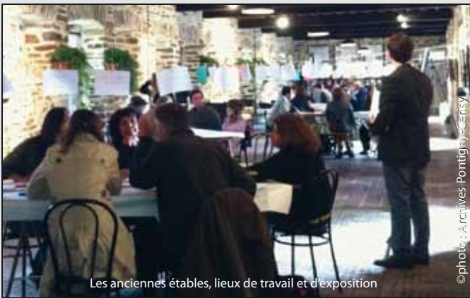
Les anciennes étables, lieux de travail et d'exposition