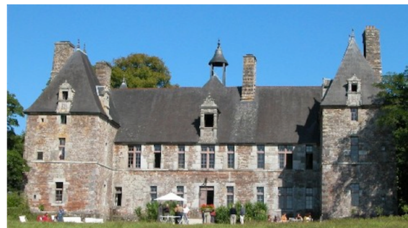
Centre Culturel International de Cerisy-la-Salle Le Château, 50210 Cerisy-la-Salle - France

du jeudi 13 juillet (19h) au jeudi 20 juillet (14h) 2017