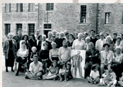
Groupe lors du colloque « Georges Méliès et le Deuxième siècle du cinéma » (1996)

Le nombre des activités s'accroît et les thèmes se diversifient. Avec l'essor des sciences sociales, les questions littéraires cèdent le pas aux problèmes de la société et aux interrogations philosophiques.