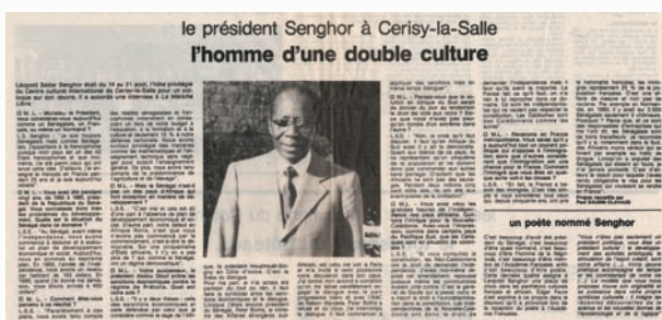
Manche Libre, 31 août 1986