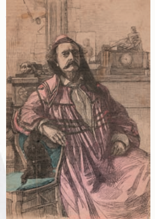
Barbey d'Aureville