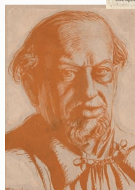
Remy de Gourmont