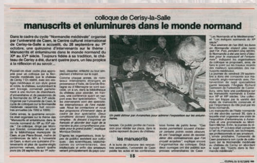
La Manche Libre, 15 octobre 1995

Conférences et débats se prolongent par des excursions en rapport avec le sujet traité : Bayeux lors de la rencontre sur La Tapisserie (1999), Coutances pour Geoffroy de Montbray (1993), le musée d'Avranches pour Manuscrits et enluminures (1995), le Mont-Saint-Michel pour Culte et pèlerinage à Saint-Michel (2000).