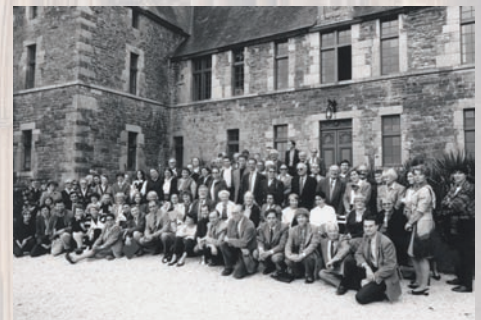
Groupe au colloque « L'architecture normande au Moyen Âge » (1994), Archives des Amis de Pontigny-Cerisy

Conférences et débats se prolongent par des excursions en rapport avec le sujet traité : Bayeux lors de la rencontre sur La Tapisserie (1999), Coutances pour Geoffroy de Montbray (1993), le musée d'Avranches pour Manuscrits et enluminures (1995), le Mont-Saint-Michel pour Culte et pèlerinage à Saint-Michel (2000).